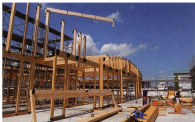
大規模木造建築の上棟の様子。